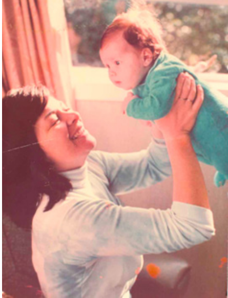
Ko māua ko tōku māmā.

I mea mai koe, i hiahia tō māmā kia tapa i a koe ki tētehi ingoa Māori, engari, kāore tō pāpā i whakaae? Nā runga i te... ?