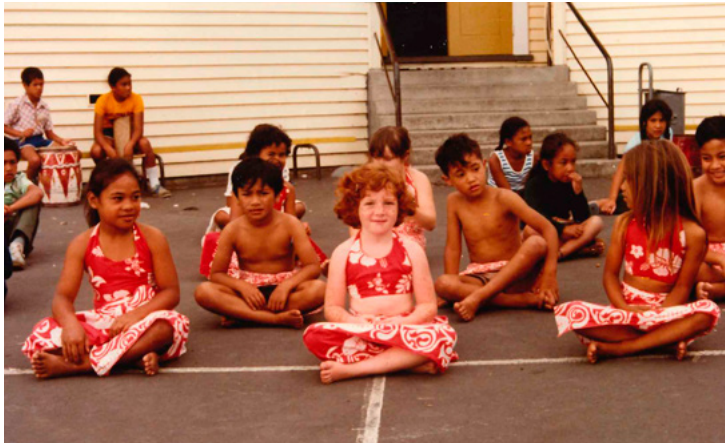
Ko au i roto i tētahi roopū Hāmoa.