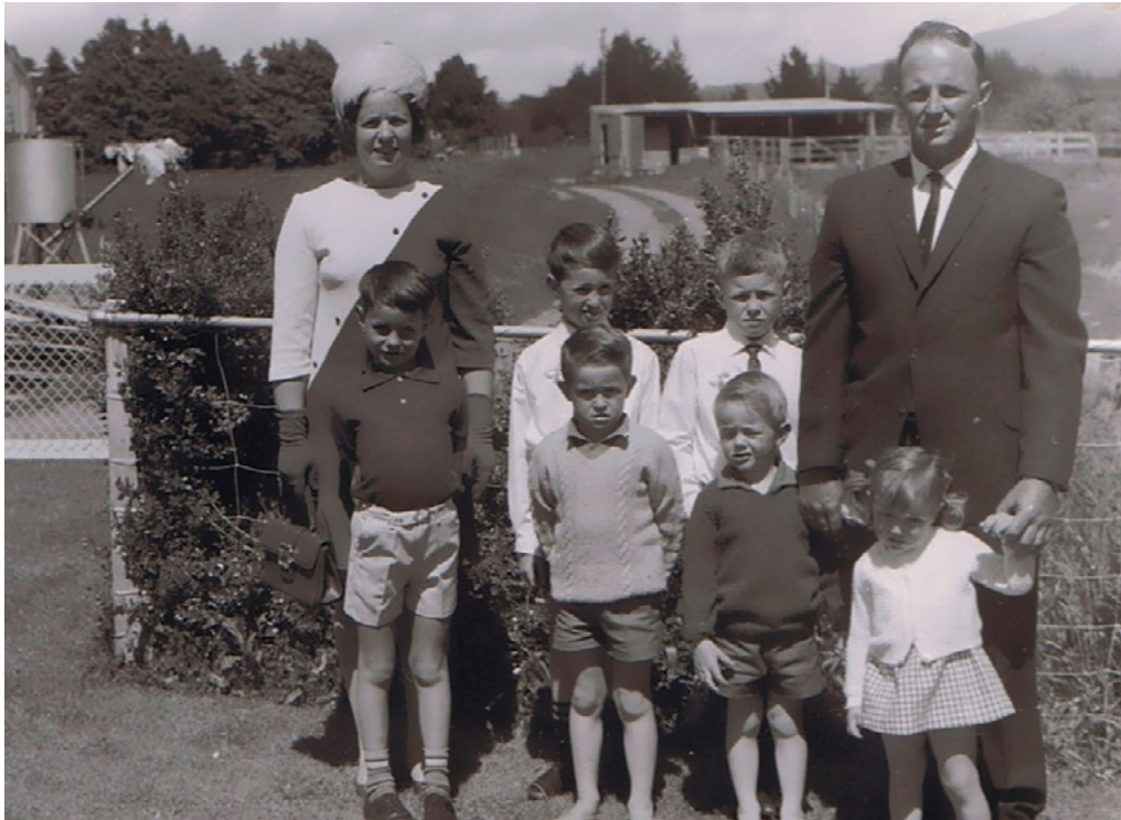
Ko mātou tēnei ki tō mātou pāmu. Ko au te tama tuarua ki te rārangi o mua e pupuru ana i ōku ringa ki muri i taku tuarā

māmā, he hapū ohore nei. Ka whānau mai, ka whāngai atu. Nō te hia tau i muri mai ka whakapā mai te mātāmua ake ki tō mātou whānau. Ka āhua whā tekau tau pea taku pakeke, ka rongohore au he tuahine anō tōku. Ka whērā ētehi āhuatanga i aua wā.