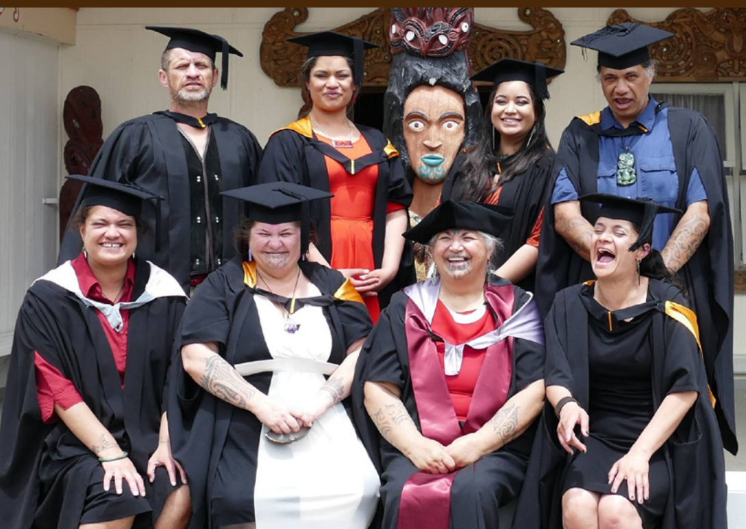
Ko mātou ko ngāku tamariki tokowhitu kua whai Tohu Paerua, Tohu Kairangi hoki i te mahau o Marutehiakina, tō mātou whareniui i te marae o Pūrekireki ki Pirongia.

Kātahi ka peka mātou ki te marae o Te Wharehuia! Ka tū te waka, i tere kite au he tangihanga! Oh my goodness! Tēnei kōtiro nō Waikato, tana wā tuatahi i roto i te rohe o Tūhoe, ā, he tangihanga! Heoi anō, ka puta mātou i te waka, ka kī mai te koroua, “Hoake!”. Kāore hoki au i te mārāma he aha te tikanga o te kupu hoake, heoi anō, i whakaaro au tērā pea me tīmata au, ā, ka kī mai ia, “Te mea tuatahi.” So, i whiua e au taku karanga tuatahi, ka hīkoi tonu mātou, ā, waimaria i mōhio au me pēwhea te whakaeke marae.