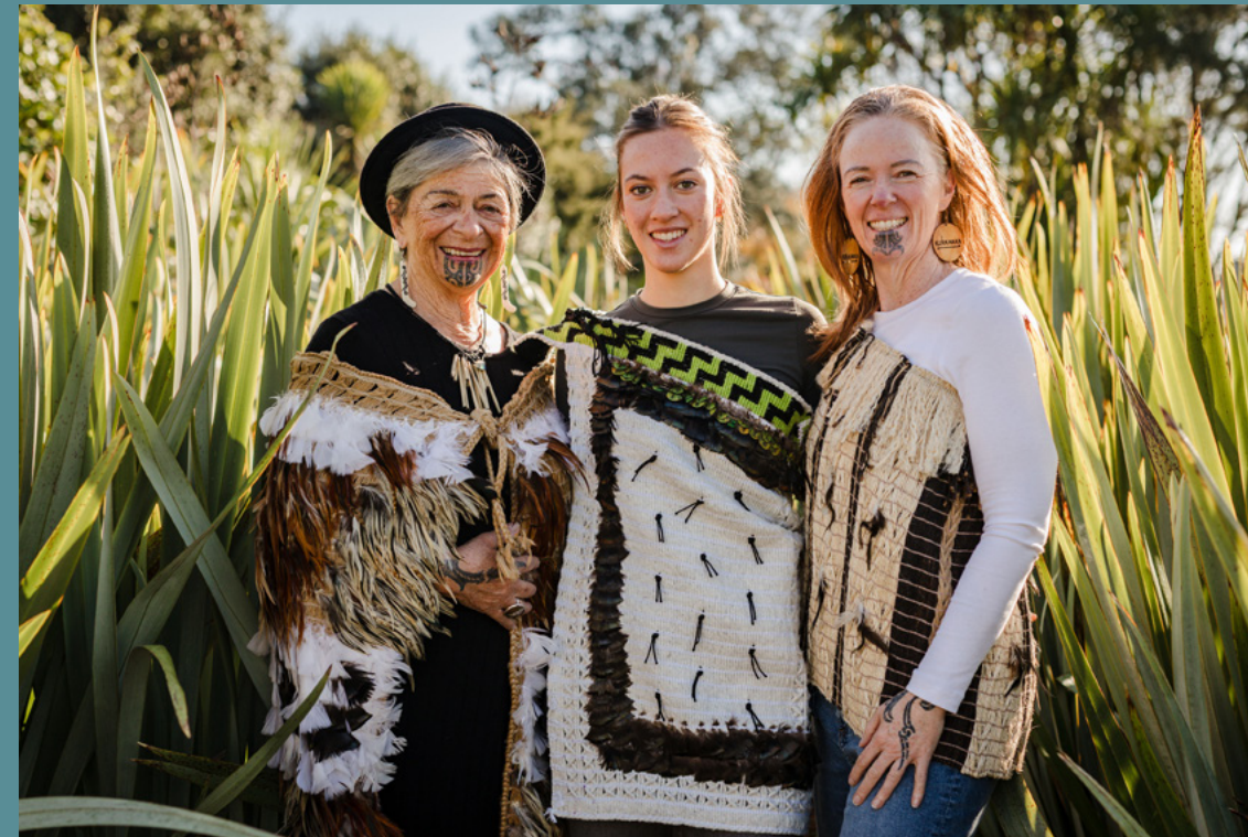
Ko mātou ko tōku māmā, ko tōku tamāhine.

...kua kōrero atu au ki ētahi e hiahia ana ki te whai ingoa Māori, engari kore kau tētahi whanaunga, hoa rānei e taea ana te āwhina i a rātou. Ko tāku ki tētahi tāne, “E tapa i a koe anō...”