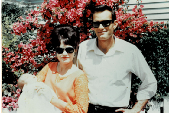
Ko mātou ko ōku mātua.

He rite tonu taku kōrero ki tōku hoa rangatira mō ngā rā o tōku ao, me taku rongu i tētehi mea e ngaro ana. Ahakoa āku mahi i roto i te ao Pākehā, te whai i taku tohu kairi-poata, te aha, te aha, i roto i ngā tau, i te mōhio tonu au kua ngaro tētehi mea. Kāore au i te paku mōhio he aha taua mea, engari, i te wā i tīmata au ki te whai i taku tuakiri Māori, ki te ako i te reo Māori, i puta mai te māramatanga, ko te mea e ngaro ana, ko taku tuakiri Māori.