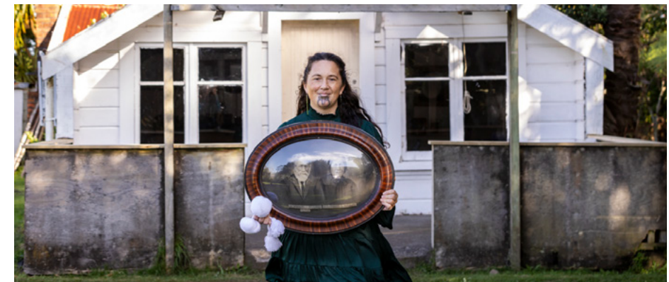
Ko au kei mua i Te Rongo o Raukawa, ki Parihaka Papakāinga.

Kāore au e tākiri atu i ōku ingoa o mua, e kāo, ka kawea tonutia e au i roto i tōku ngākau, i roto hoki i ngā kōrero ka tukua iho ki aku tamariki e pā ana ki taku ohinga, ā, mā rātou e tuku aua kōrero ki ā rātou mokopuna ā tōna wā. Heoi, ko te ingoa kua tapaina mai nō muri tata nei, koinā te ingoa i manakohia e tēnei kōtiro i a au e taitamariki tonu ana, koinā hoki te ingoa tika hei kawenga māku ki te aroaro o te ao whānui, pēnei i taku kauae e hāpai nei i te mana o ōku tūpuna. Ko au, ko ōku tūpuna, ā, katoa katoa o ōku tūpuna wāhine he wāhine toa, ko rātou ngā mea i tūtamawahine i te wā o te kore. Nō reira, ko tōku ingoa he raukura, ā, ko taku raukura rā, he manawanui ki te ao.