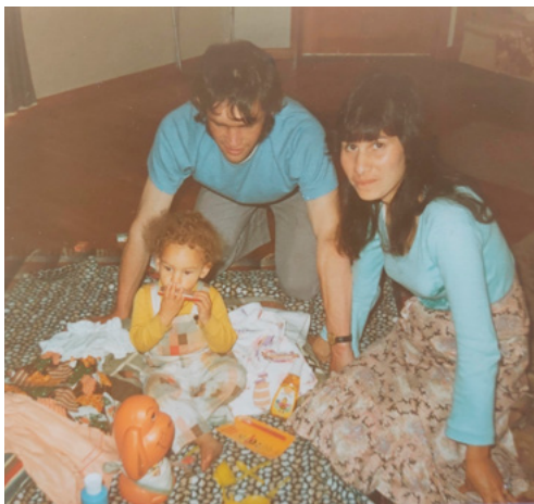
Ko mātou ko Pāpā, ko Māmā

Ko tōku koroua, he āhua rite ki taku whaea, he pai tana whakarongo ki te reo, engari kāore au i tino rongō i a ia e kōrero ana. Ko taku kuia, ko tōna reo tuatahi tērā, engari ka kaha huri ia ki te reo Pākehā i tōna taiohitanga. I pērā i runga i ngā āhuatanga o te wā me ngā pēhitanga i pā ki te iwi Māori, ki ngā tamariki Māori hoki ki te kura. I te wā e whawhai ana ia mō te whenua, i ngā tau whitu tekau, i tīmata anō ia ki te whakamahi i tōna arero Māori i roto i ngā huihuinga Māori, i roto hoki i ngā uiui me ngā kairiipoata reo Māori. I tōna kaumātuatanga, ka kōrero Māori hoki ia ki ngā mokopuna i te kōhanga reo, ā, i a au e ako ana i te reo ki te whare wānanga, tērā ētehi wā i kowhete ia i ahau mō taku whakamahi i te mita o iwi kē, i wero rānei ia i taku pīnati me ētehi rerenga Māori.